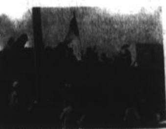
Los trabajadores de Crown Cork, cercados por la policía 53 días. Los obreros han amenazado con volar los tanques de gas si es que la policía interviene e intenta desalojarlos de la fábrica.