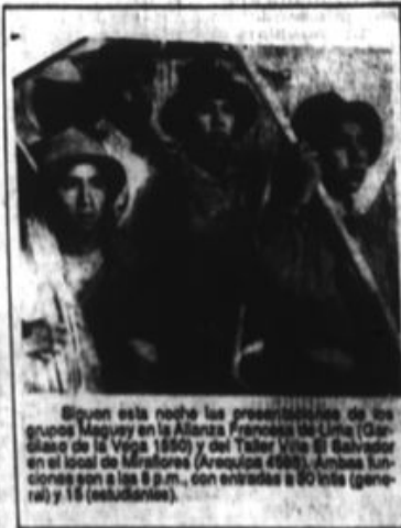
Siempre esta noche las presentaciones de los grupos Maguay en la Alianza Francesa de Lima (Galería de la Vega 1850) y del Taller Vela El Salvador en el local de Miraflores (Arequipa 498). Ambas funciones son a las 8 p.m., con entradas a 80 intls (general) y 15 (estudiantes).

Cualquier información al respecto puede ser solicitada a los Ministerios de Cultura de Cuba y Nicaragua.