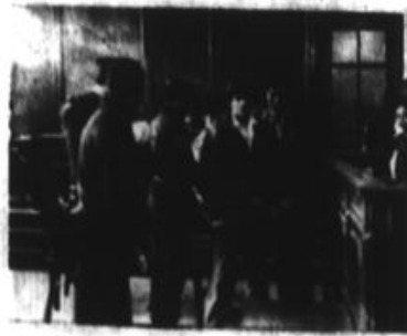
Efectivos policiales cometen atrocidades policiales con los pobladores de Sicuani.