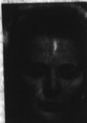
Margaret Thatcher tuvo principal actuación en el apoyo al régimen de Sudafrica.

La presidencia de la CEE, en manos de Holanda, había basado su propuesta de sanciones en la reciente