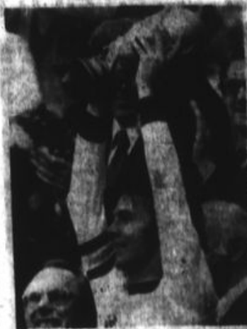
Frank Beckenbauer cuando se coronó campeón mundial en 1974. Hoy es entrenador de la selección de su país en México '86.

presariales que lo convirtieron en un millonario. Desde hace años forma parte del equipo editorial de la norcaliforniana "Warner Communications" y está en México como comentarista de la Cadena Computer, una transnacional japonesa que fabrica equipos electrónicos. A la copa mundial de México amaron otros dos brasileños de fama internacional también como comentaristas de televisión. Uno es Mario Zagallo, tres veces mundialista por Brasil: como jugador en 1958 en Suecia y en 1962 en Chile, y como director técnico del "Santos" en 1970. Figura de este último mundial es también Rivelino, quien durante un corto tiempo se fue a ganar petrodólares en el fútbol de Arabia Saudita y luego regresó a su país donde es un pequeño magnate dueño de una red de gasolineras.