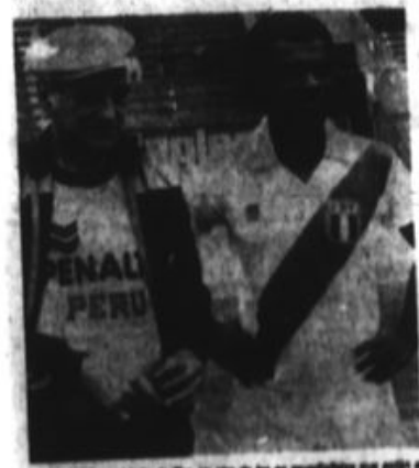
Teófilo Cubillas, ex delantero de Chile, es otro de los ex mundialistas que están en México. Él se ha dedicado a cultivar y ampliar sus actividades deportivas.

Estuvieron en la copa de 1978 en Argentina y en la de España de 1982. En una revolución que causó impacto en los medios periodísticos del mundo de México y exterior en la FIFA, Obilitas aseguró aquí que estuvo "arreglado" el partido en que Argentina goleó 6-0 a Perú en los cuartos de final de 1978. "Aunque las pruebas son difíciles de obtener, creo que así corrió el partido", afirmó el ex jugador izquierdo paraguayo. Los argentinos necesitaban golpear para desplazar a Brasil y pasar a la final de ese torneo donde finalmente resultaron campeones. Cubillas desmintió a su ex compañero de equipo. Un record difícil de superar es el del mexicano Antonio Carballo, cinco veces portero de la selección mexicana en otros tantos mundiales: 1950, 1954, 1962, 1966 y 1970. Desde hace años es un conocido y respetado comentarista de la televisión mexicana.