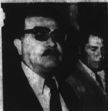
El ministro de Pesquería ha reconocido que hay malos manejos en su portafolio.