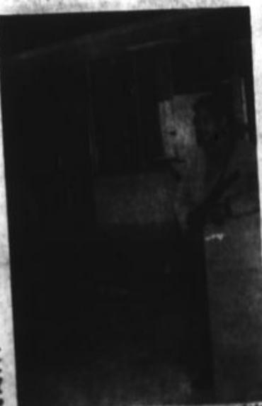
Una bomba ubicada en un baño de mujeres, uno de los baños de gran poder explosivo no llegó a estallar ante el aviso de los propios señores.

Una vez más de este tipo, cuyo puesto es utilizado frente al aeropuerto, fue observado a una mujer del grupo, de tipo cubano y de nombre conocido de haber ingresado a los servicios higiénicos. Luego comenzó a salir humo sin dar a parar.