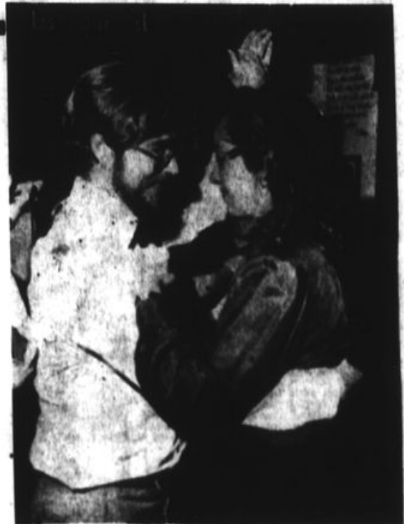
Tomando la iniciativa por un lado, cabeceita gacha por otro.

-Ninguna le resiste. Los preservativos con "espumas" tienen gráficos con tiras de esponja