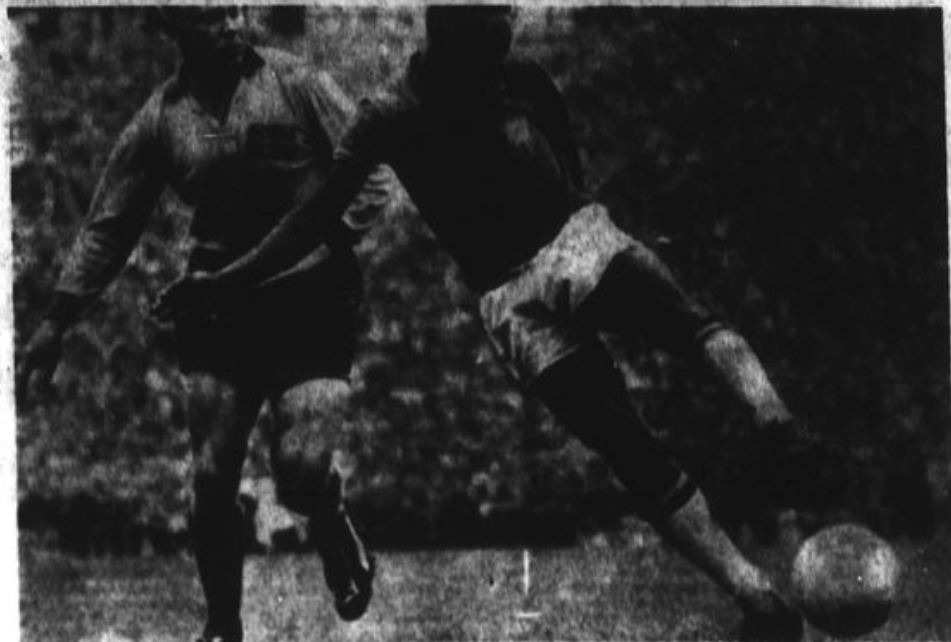
Como muchos de los ex mundialistas, Pele también está en México como comentarista para una importante transmisión de las telecablemexicanas.