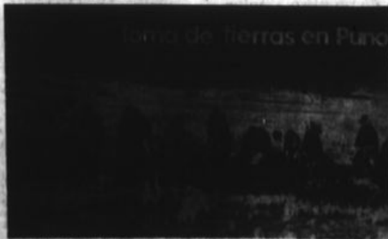
Reunión Agraria intenta controlar las empresas campesinas, principalmente a través de las zonas más ocupadas como Puno.

autónomas del campesinado puneño en la Comisión de Reestructuración creada para tal fin.