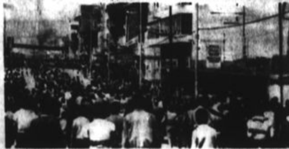
El comercio se verá incrementado en Moyobamba cuando se inicie la semana turística de la ciudad.

Esta actitud calificó de lamentable e insistió a la Sociedad Paramonga a cambiar de actitud para hacer realidad esta obra anhelada por el pueblo.