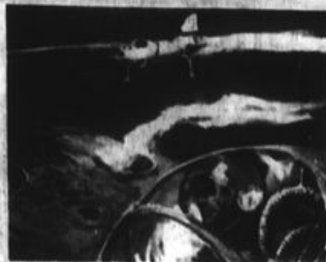
La obra de Bruno Bettheim es una guía para la formación de valores.

Los niños (entre los seis y once años) que pueden ver televisión se enganchan con frecuencia por encima del espacio, en que están bien delimitadas las características de unos y otros personajes, y en que la fantasía (naves que vuelan por el hiperespacio, seres deformes, héroes con poderes sobrehumanos, planetas completamente diferentes