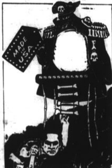
Muchos muertos tuvo en su haber Enrique Bermúdez.

El forzado ocio de Bermúdez no duró mucho. En 1980 el diario "Washington Post" señaló, sin tapujos y con el beneplácito de autoridades locales, la necesidad de prestar "ayuda internacional" a la con-