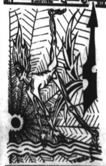
Cinco poemas inéditos