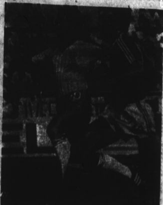
Gary Linhart se convirtió nuevamente en el arquero inglés que ayer golé por tres a cero a los paraguayos.

Esta actuación discriminatoria a los paraguayos que, luego de recibir un amonestación al árbitro, fueron castigados terreno y solo en los minutos finales del encuentro demostraron sus "garra guaraní", pero al menos los los consumidos para jugar con la alta conciencia, por lo que ellos califican al árbitro como un vasallo del imperio británico.