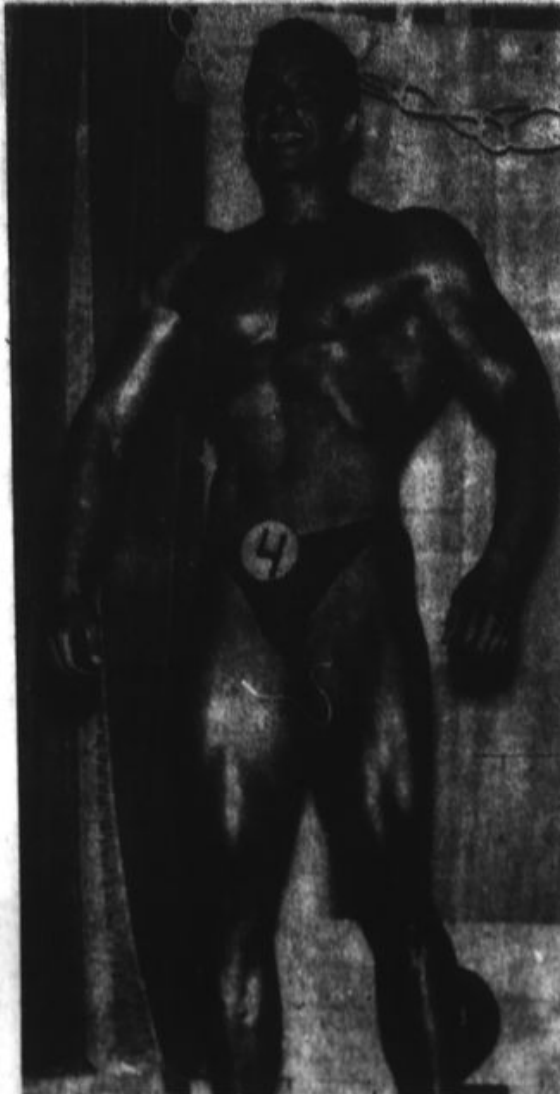
Machopésimo, un deporte camión.

La tara machista ha trepado el cerebro a mucha gente, y se nota con mayor intensidad en los luchos del sexo. Le hemos seguido la ruta a vendedores de estimulantes, afrodisíacos y objetos diversos. Aquí el itinerario.