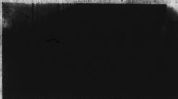
Los internos de la Marina tomaron el muelle de embarque hasta El Frontón

La acción de fuerza se inició aproximadamente a las cinco de la mañana del día de ayer (desarrollando a los custodios de la Guardia Republicana, también como rehenes a muchos de ellos y a los empleados de los Establecimientos Penales, inmediatamente la acción del gobierno y de las Fuerzas Armadas han tratado de aprovechar la situación creada para obligar por la fuerza al traslado a Caselle Curiones, presidente actual sustruido por la presión de la dirección, al Ministerio de Justicia y el Comando Conjunto. El resto de los hechos nos puede dar una idea de lo sucedido, cuya última víctima pudo generar nuevamente una tragedia nacional.