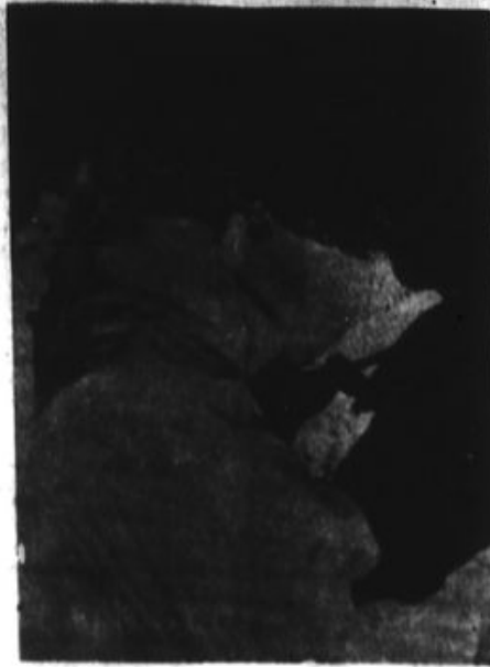
Valentino, porque el tango es macho, inició el estilo.

-No, tanto como eso no, sino que la tulana me ha resultado bien brava y no quiero quedar mal en la taena.