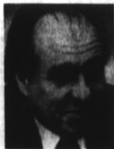
El presidente uruguayo, Julio María Sanguinetti, afronta numerosas problemáticas internas en su país.